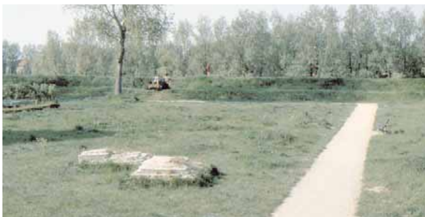
De voetstenen of teerlingen van de oorspronkelijke standerdmolen, gevonden bij de restauratie van de wallen in 1973.

de vier teerlingen of voetstenen te zijn waarop in de 17e eeuw de houten standerdmolen had gestaan. Deze ontdekking was de aanleiding voor het smeden van plannen om de oude standerdmolen (of standaardmolen, zoals ze ook genoemd worden) in ere te herstellen.