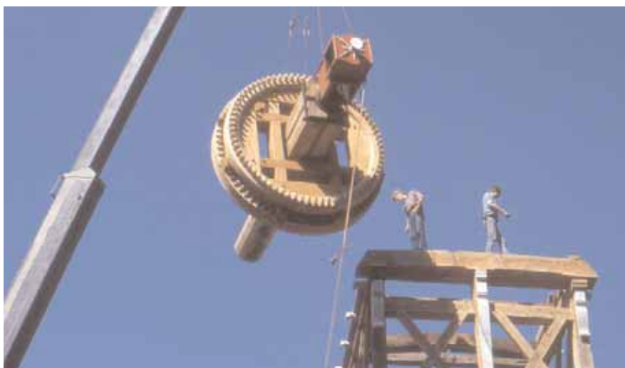
Werken op hoogte in 1986. Op deze manier zou het thans (2008) niet meer mogen.

soort werk onmiddellijk stilleggen. Zonder het gebruik van stellingen en hoogwerkers zou de bouw van een standerdmolen in onze tijd niet meer mogelijk zijn.