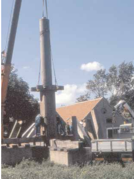
De stander of staander, het onderdeel waaraan de molen zijn naam dankt.