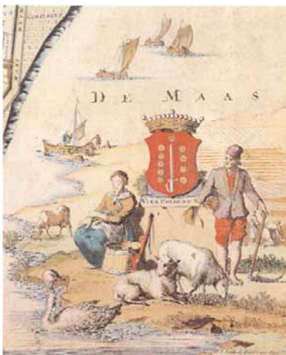
Afdruk van een deel van de koperen plaat van Vierpolders.

Ondanks dat door de reorganisatie van het waterschapsbestel en de daarmee verband houdende schaalvergroting de afstand tussen burger en waterschap niet alleen geografisch, maar ook bestuurlijk groter is geworden, mogen we verzekerd zijn van blijvende betrokkenheid met onze streek, zoals die onlangs door de bekera van Oudendoorn en de koperen platen zo duidelijk tot uitdrukking kwam. Reden voor ons om de huidige belastingaanslagen van dit waterschap met blijdschap te betalen. In ieder geval was het voor mij aanleiding een artikel te schrijven, getiteld: "Hoera, een aanslagbiljet waterschapsbelastingen", in december vorig jaar gepubliceerd in Delta Nu, het personeelsblad van het waterschap Hollandse Delta. Nadat wij bereidheid tot betaling van belasting betoonden, wil ik nu