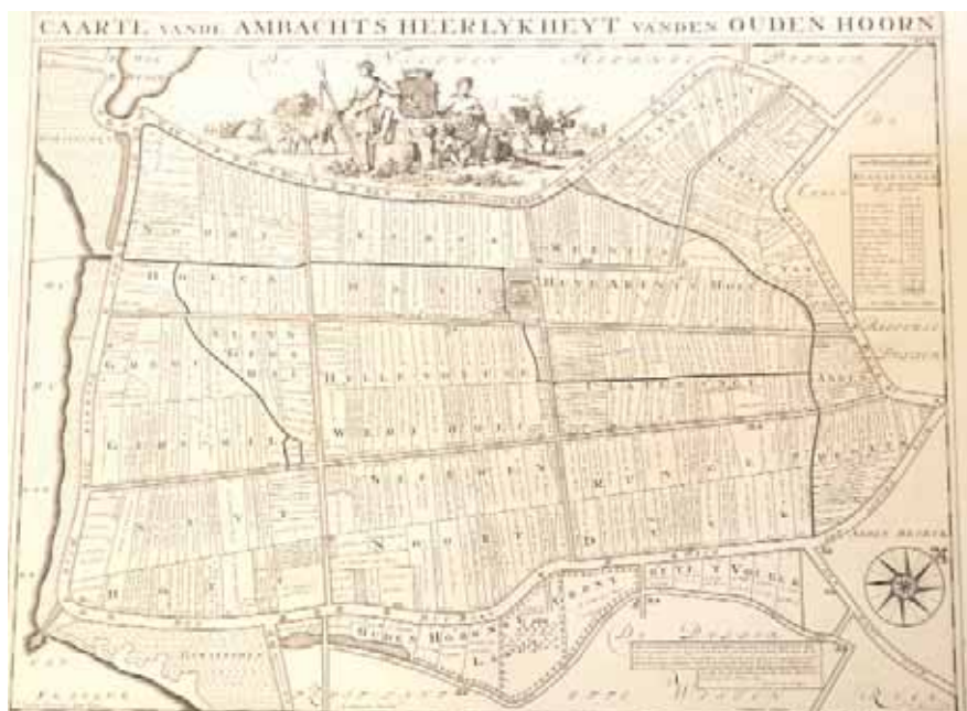
Polder Oudenhoorn op een kaart uit 1697, de tijd dat bokaal en drinkbeker in gebruik waren.

De Brielse Dijkkring werd opgericht op 1 juni 1954, als rechtsopvolger van de Hoogheemraadschappen van Voorne, van Putten en van de Bernisse. In het kader van de Deltawerken werd toen de noodzaak gevoeld de strijd tegen het water anders te organiseren. Kennelijk was de tijd rijp voor fusie. Nadat eerst gedacht werd aan drie waterschappen, namelijk aparte organisaties voor Voorne, Putten en Rozenburg, bleek er voldoende draagkracht in de streek te bestaan voor een gezamenlijke aanpak, en dat werd dus De Brielse Dijkkring. Een blik op de kaart maakt duidelijk dat dit waterstaatkundig gezien een logische aanpak was. In die tijd was overigens de taak van de Brielse Dijkkring beperkt tot de waterkering en de zoetwatervoorziening. Bij de ramp in 1953 was al duidelijk geworden dat de