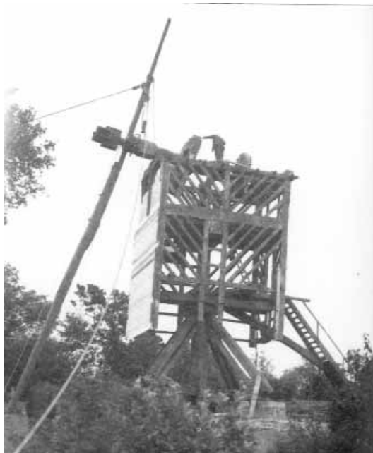
Herbouw van een standerdmolen in 1947 op de Casselberg bij het stadje Cassel in Frans-Vlaanderen, ten westen van Ieper. De molen werd volledig onder gebruikmaking van de oorspronkelijke technieken gebouwd (foto: Gustave Descamps). Bron: zie (2) .

helemaal met elkaar eens welke werkwijze in de 16e en 17e eeuw werd toegepast. (1,2) Vermoedelijk werd destijds een zo genoemde ‘rechtmast’ toegepast, zoals te zien op onderstaande foto.