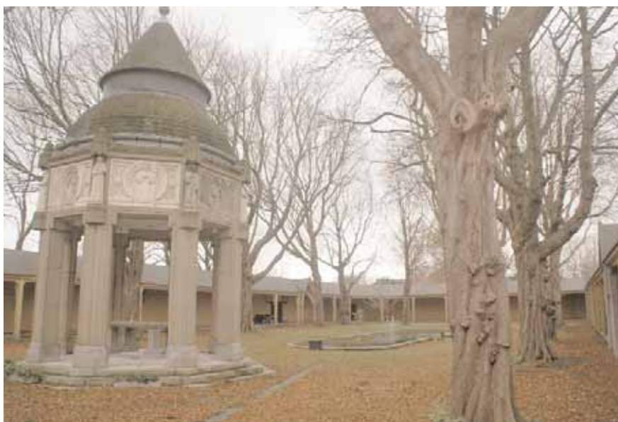
Ciborium, omgang en bassin.

Kerk en klooster werden in april 1572 door de Watergeuzen geplunderd en verwoest. In juli van datzelfde jaar hingen de geuzen negentien, in Gorinchem gevangen genomen, rooms-katholieke geestelijken op in een nog overeind staande turfschuur van het Regulierenklooster. De lijken werden vervolgens ter plaatse begraven. Halverwege de 19e eeuw verschenen de eerste pelgrims ter plaatse. Het aantal gelovigen dat jaarlijks de plek bezocht, steeg gestaag. Toen dankzij een opgraving in 1877 de exacte locatie van de turfschuur kon worden bepaald, werd ter plekke een in 1880 door E.J. Margry ontworpen kapel gebouwd. Omdat er in de nabijheid van de vesting geen stenen bebouwing mocht verrijzen, werd de kapel vrijwel geheel van hout vervaardigd. Voor het in alle beslotenheid houden van processies behoorde bij de kapel een houten omgang die het Martelveld omsloot. In 1912 werd de door een storm