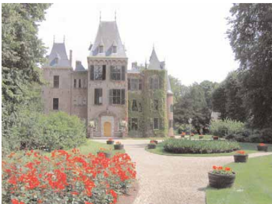
Kasteel Keukenhof, Lisse.