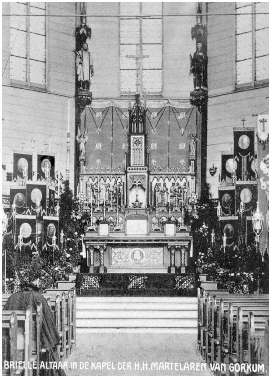
Hoofdaltaar van de houten kapel die ten westen van de omgang stond.