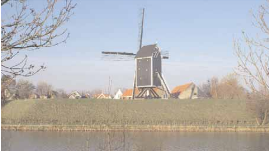
Standerdmolen 't Vliegend Hert uit 1986 op het Molenbolwerk in Brielle.