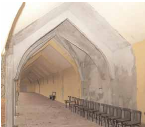
Detail van de omgang, met proefrestauratie van het betonwerk.