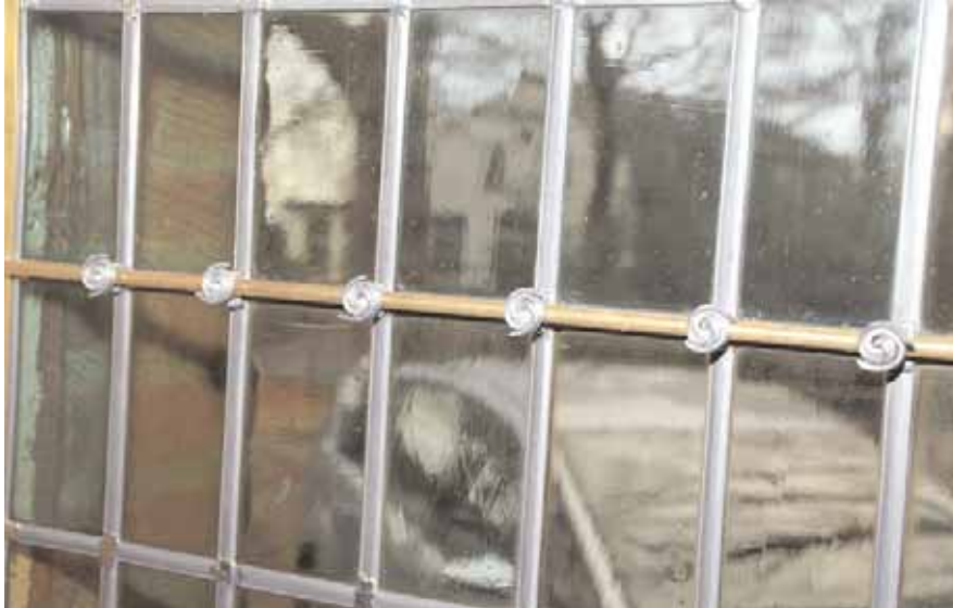
Detail van het herstel van de glas-in-lood ramen.

Gedeelten van de tegelvloer in de kerk moeten nog vervangen worden, sommige tegels liggen los. Bij een vorige vervanging zijn tegels van een verkeerd formaat gebruikt. De tegels komen uit Engeland.