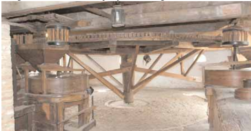
Rosmolen, voor het malen van boekweit en mosterd, ongeveer zoals ooit in gebruik in het pand waar nu restaurant 't Kont van 't Paard aan de Kaatsbaan 1 in Brielle gevestigd is.

Zoeken op Internet levert als resultaat dat in de Middeleeuwen het energieverbruik ongeveer 9000 kWh per persoon per jaar bedroeg (4) . Bij een bevolking van (geschat) 2500 personen was het totale energieverbruik in Brielle per jaar dus ongeveer 22.500.000 kWh.