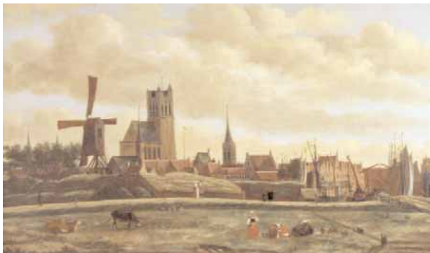
Standerdmolen op het schilderij 'Gezicht op den Briel' van Daniël Vosmaer uit circa 1660 (Collectie Detroit Institute of Arts, Detroit, langdurig bruikleen aan het Historisch Museum Den Briel).

Houten molens vragen regelmatig onderhoud, reden waarom men omstreeks het einde van de 17e eeuw overging tot de bouw van stenen molens. Ook stenen molens waren kwetsbare objecten. Met name brand, door blikseminslag of oververhitting van het maalwerk, was een gevaar. De laatste windmolen die Brielle rijk was, ging op 30 januari 1882 door brand verloren. Ofschoon de molen goed verzekerd was, zag men geen heil in herbouw. In juni 1882 werden de restanten gesloopt. Het leek er op, dat daarmee de geschiedenis van windmolens in Brielle afgelopen was.