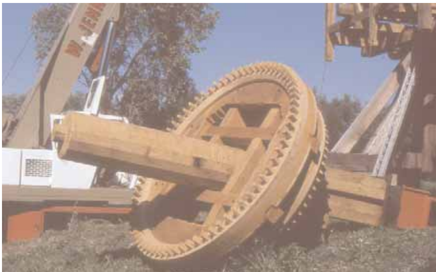
Hoofd met aswiel, gereed om door middel van een mobiele kraan in de molen gehesen te worden.