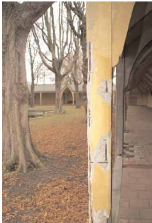
Door betonrot zwaar beschadigde kolom in de omgang.