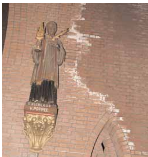
Vochtplekken aan een buitenmuur, ten gevolge van een onjuiste constructie van de dakgoten.

Een grote, maar zeer dringende, operatie was de restauratie van het dak van de kerk. De zinken bekleding in de inpandige dakgoten was verkeerd aangelegd. Aan de binnenkant van de goot was de bekleding namelijk lager dan de buitenkant, waardoor bij stortbuien het regenwater de kerk kon binnendringen met alle gevolgen vandien. Nu het water niet meer binnen kan komen, drogen de vochtplekken in de kerk langzaam op. Van het nieuwe dak mag verwacht worden dat het zeker 50 jaar zal meegaan. Het is overigens triest om te horen dat ook de kerk het slachtoffer is van lood- en koperdieven.