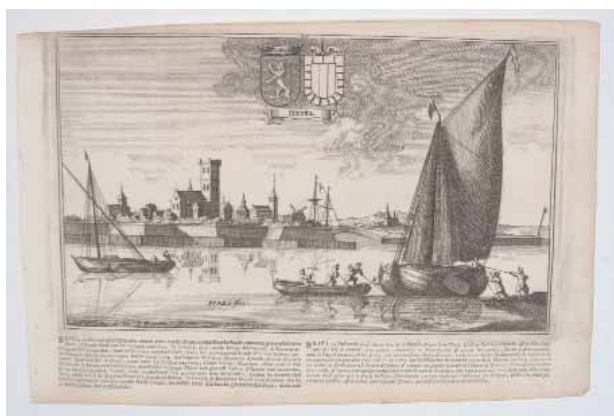
Ets 'Briel' uit circa 1673 door Johannes Peeters en Gaspar Bouttats (collectie Historisch Museum Den Briel).

meer in het Maritiem Museum Rotterdam en het Nationaal Scheepvaartmuseum in Antwerpen. Peeters maakte tussen 1670 en 1673 een serie van circa 100 tekeningen van stadsgezichten in de Nederlanden en grensgebieden. Deze tekeningen werden vanaf 1673 door de Antwerpse etser Gaspar Bouttats (1625-1675), met toestemming van Peeters ( cum privilegio ), in het koper overgebracht ( fecit ) en samengevoegd tot het plaatwerk Thooneel der Steden ende Sterckten van 't Vereenight Nederlandt met d'aengrensende Plaetsen soo in Brabant, Vlaenderen als anden Rhyn en elders veroverd door de Waepenen Der Groot-moghende Heeren Staeten , dat in 1674 verscheen. De prent is een afdruk op papier van de koperplaat, wat bevestigd wordt door de moet, ook plaatrand genoemd.