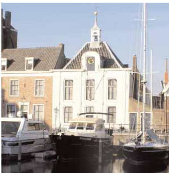
Huis aan de oude haven in Goes waar ooit een getijdenmolen gevestigd was (foto F. Keller).

Bij de getijdenmolens werd tijdens vloed water in een spaarbekken (het molenwater) opgevangen. Bij hoogwater werden de sluisdeuren gesloten en werd er gewacht totdat het buitenwater weer een eind gezakt was. Dan werd het water uit het molenwater over de getijdenmolen gevoerd en kon er arbeid worden verricht. Wanneer we uitgaan van 2500 bedrijfsuren en een vermogen van 40 kW komen we op een hoeveelheid arbeid van 100.000 kWh. Opgeteld bij de 250.000 kWh van de windmolens komen we alvast op 350.000 kWh.