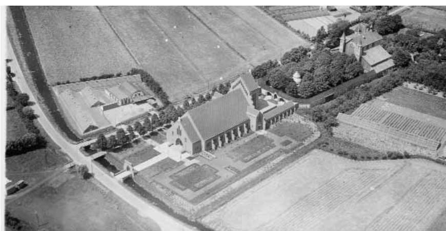
Het bedevaartscomplex, vermoedelijk gefotografeerd kort na de bouw van de 'nieuwe' kerk in 1932. Rechts achter de in 1947 gesloopte houten kapel.

Aanleiding voor het artikel vormde de aanwijzing van het bedevaartscomplex aan De Rik als 'jong' rijksmonument. Een monument waarvan geconstateerd werd dat het in een bouwkundig slechte staat verkeerde. Met name de kerk en de omgang dienden dringend gerestaureerd te worden.