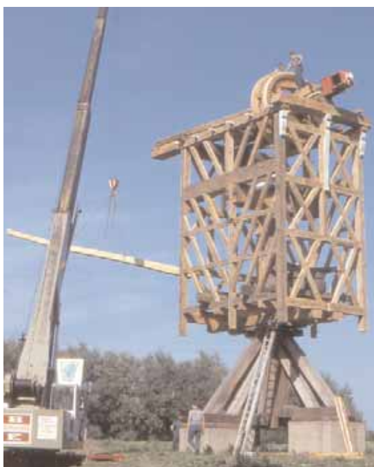
Montage van de roeden door middel van een hydraulische kraan.

Zoals op de foto te zien is, werd de molen met behulp van een hydraulische kraan in elkaar gezet. De geleerden zijn het niet