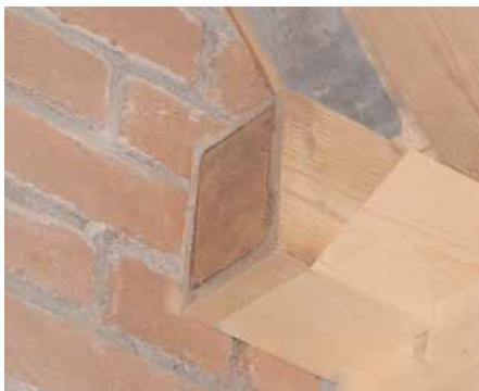
Detail van de restauratie: nieuwe balk, met balkkop van de oude balk, versierd met bladgoud (het donkere vlak in het midden van de foto).

De einden van de balken in de dakconstructie waren beschilderd met bladgoud. Om deze kunst na vervanging van de balken te kunnen behouden, is telkens de kop van de oude balk afgezaagd en aangebracht tegen de nieuwe balk.