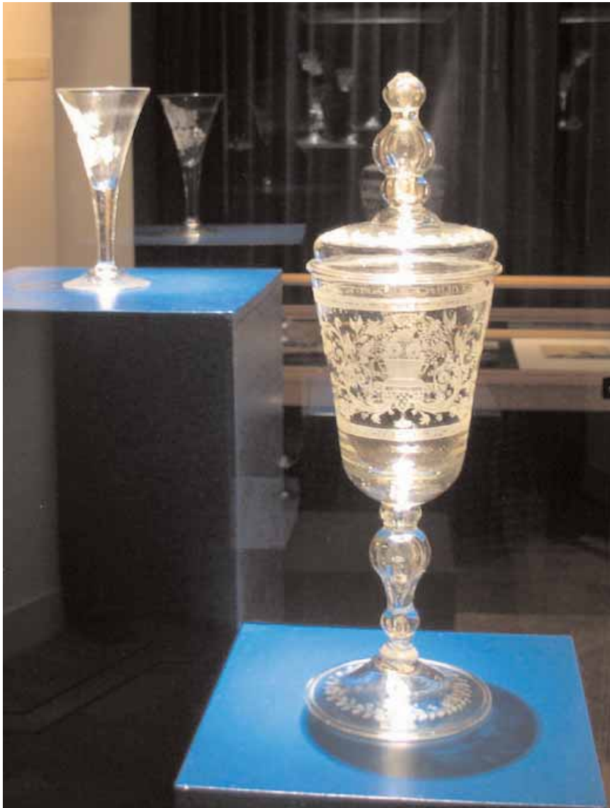
Bokaal en drinkbeker van de polder Oudenhorn (collectie waterschap Hollandse Delta; langdurig bruikleen aan het Historisch Museum Den Briel).