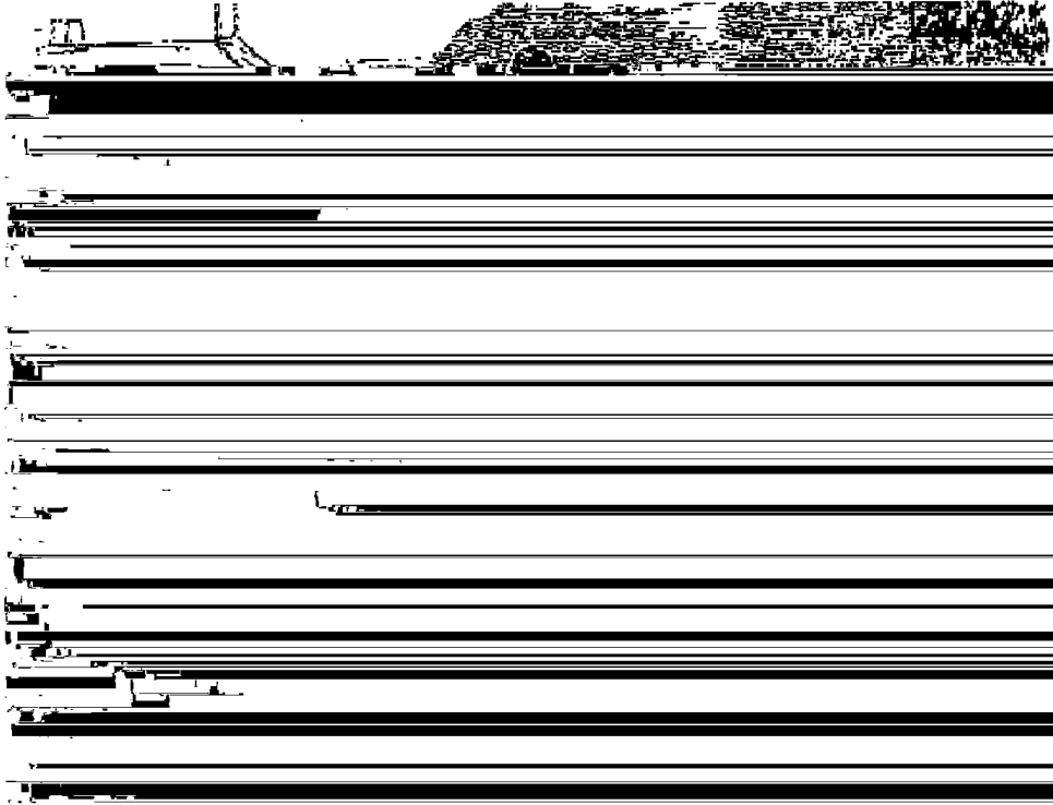
Nog in de 18de eeuw vonden mensen de dood op de brandstapel, zoals hier een vermeende heks in Amerika.