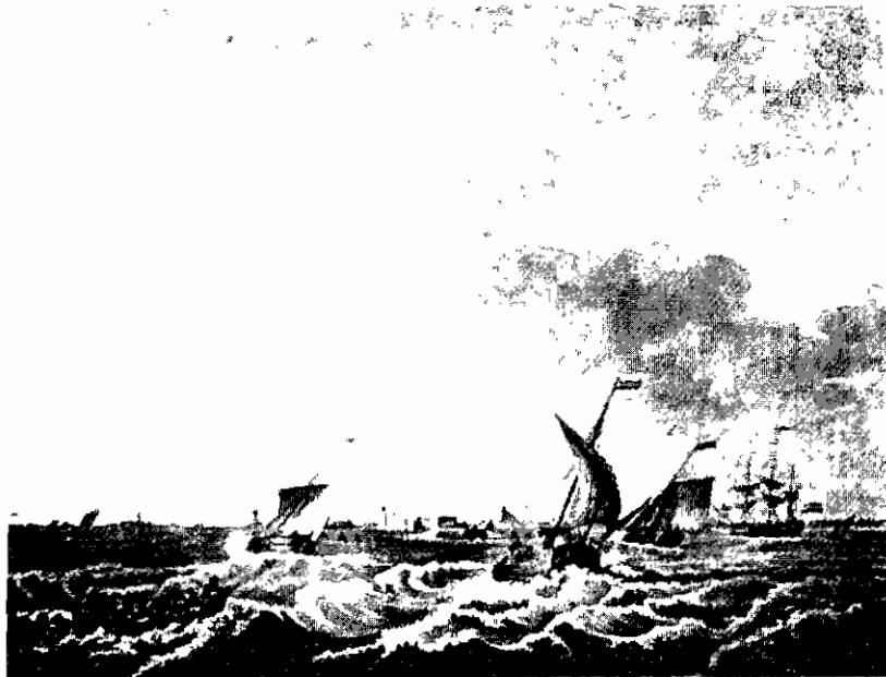
Gezicht op de haven van Hellevoetsluis

De duur van de overtocht was sterk afhankelijk van wind en zee.