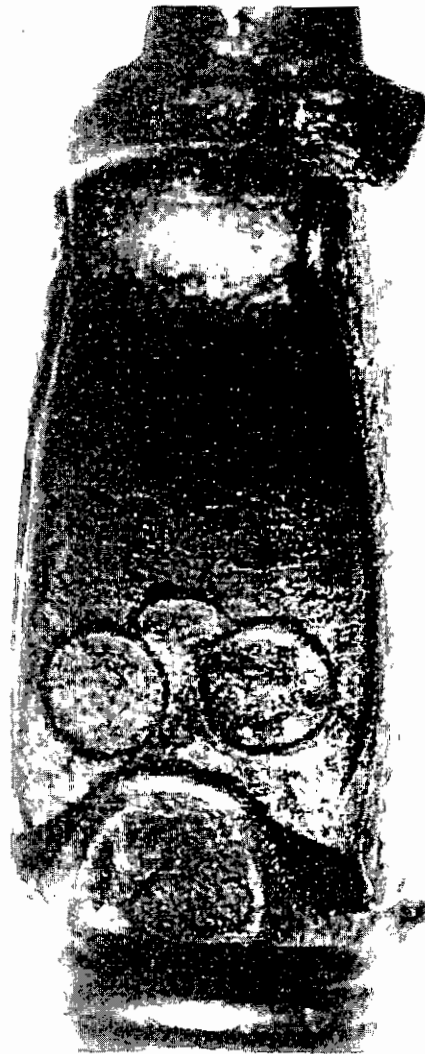
afbeelding 2: Gevest van zwaard met als stedelijk symbool van Den Briel een knijpbril. Dit gerechtszwaard hing in de kamer van het stadhuis, waar recht werd gesproken (Trompmuseum Brielle, oud inv.nr.196)