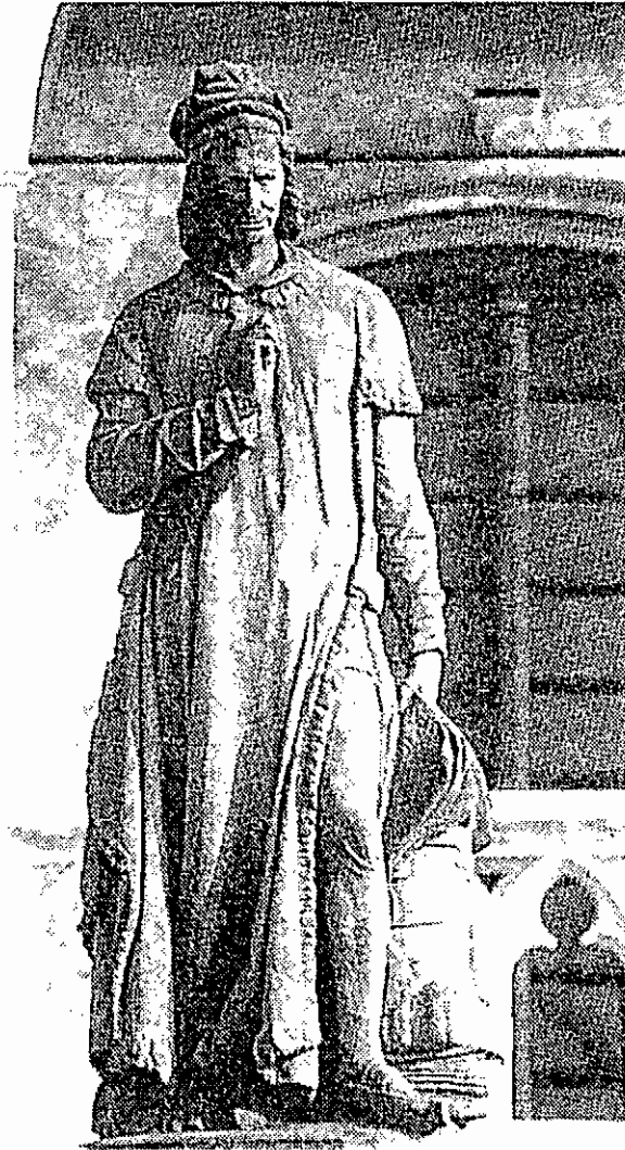
afbeelding 2: standbeeld van Jacob van Maerlant te Damme.