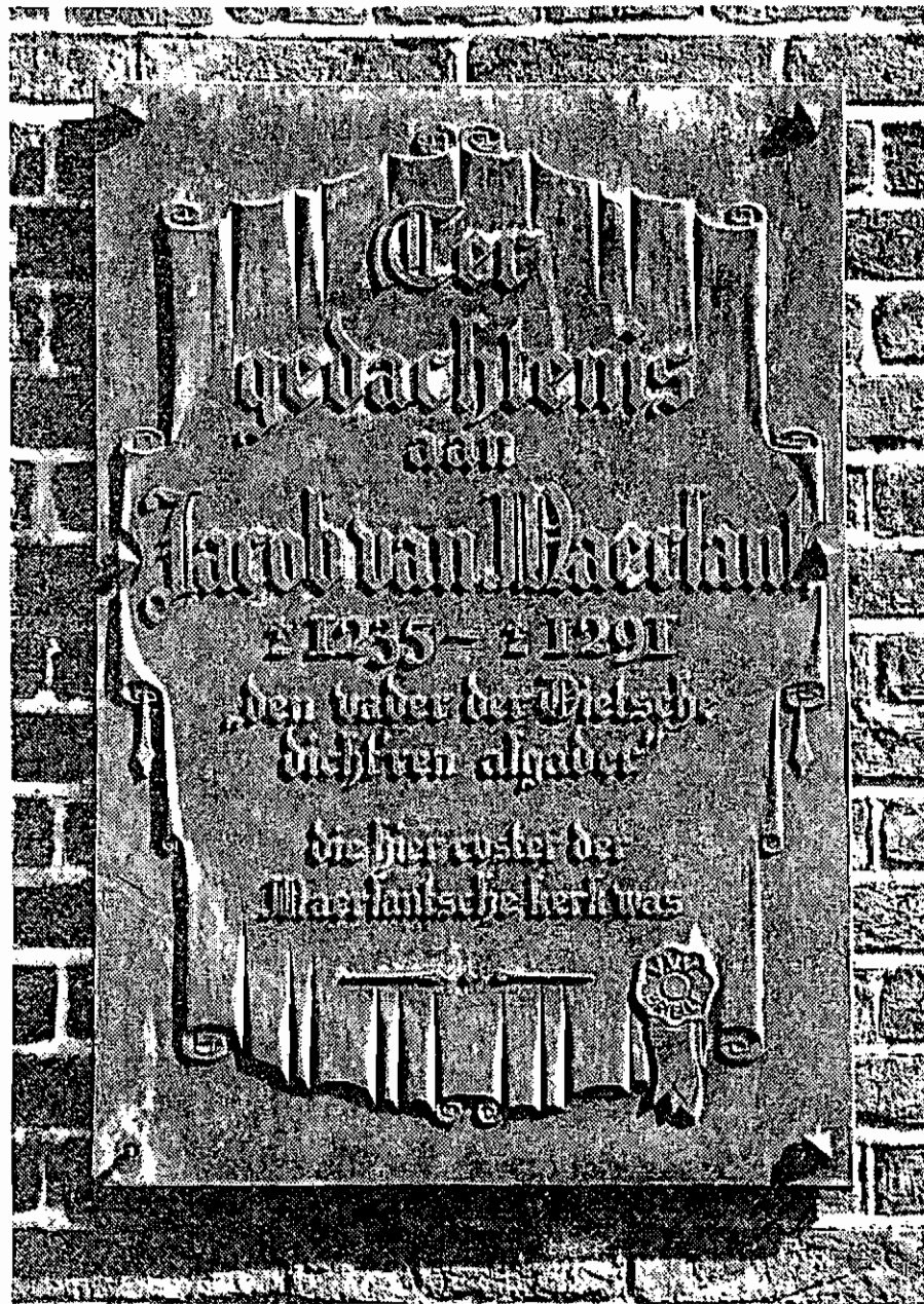
afbeelding 3: De bronzen Jacob van Maerlant- gedenkplaat aan het Asylplein.